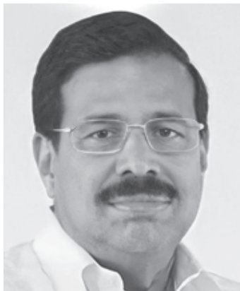
പി.വി.ഗംഗാധരൻ മാതൃഭൂമി ഡയറക്ടർ, ചലച്ചിത്ര നിർമ്മാതാവ്