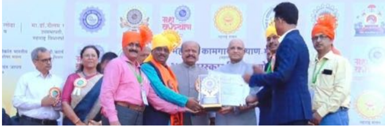
മഹാരാഷ്ട്ര സർക്കാരിന്റെ കാംഗാർമിത്ര അവാർഡ് ഗവർണർ രമേഷ് ബൈസ് ബി.എം.എസ്. നേതാക്കൾക്ക് കൈമാറുന്നു.

മുംബൈ: മഹാരാഷ്ട്ര സർക്കാരിന്റെ കീഴിലുള്ള മഹാരാഷ്ട്ര ലേബർ വെൽഫെയർ ബോർഡ് 2021-22 വർഷത്തെ ഏറ്റവും നല്ല സംഘടനയ്ക്കുള്ള നാരായൺ മേഘാജി ലോഖണ്യേ കാംഗാർമിത്ര അവാർഡ് ഭാരതീയ മസ്ദൂർസംഘ് മഹാരാഷ്ട്ര പ്രദേശ് അർഹത നേടി.