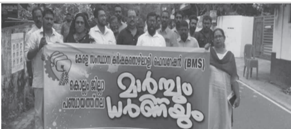
കർഷകത്തൊഴിലാളി ഫെഡറേഷന്റെ ആഭിമുഖ്യത്തിൽ കൊട്ടിയം - നെടുമ്പന കൃഷിഭവൻ മുന്നിലേക്ക് നടത്തിയ മാർച്ച്.