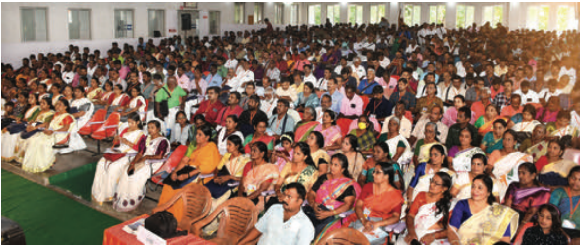
പാലക്കാട് ജില്ലാ സമ്മേളനത്തിൽ പങ്കെടുത്ത പ്രതിനിധികൾ