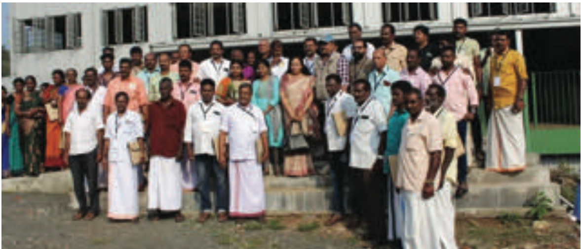
പീരുമേട്ടിലെ എച്ച്.എം.എൽ ഫാക്ടറി സന്ദർശിക്കുന്നു.

കണ്ടെത്തുകയും അവ ബന്ധപ്പെട്ടവരുടെ ശ്രദ്ധയിൽപ്പെടുത്തി അത് പരിഹരിക്കുകയും ചെയ്യുന്നു. തൊഴിലാളികൾക്ക് തെരഞ്ഞെടുത്ത കമ്മിറ്റി മുഖേന നേരിട്ട് പരിശീലനം നൽകുകയും ചെയ്യും.