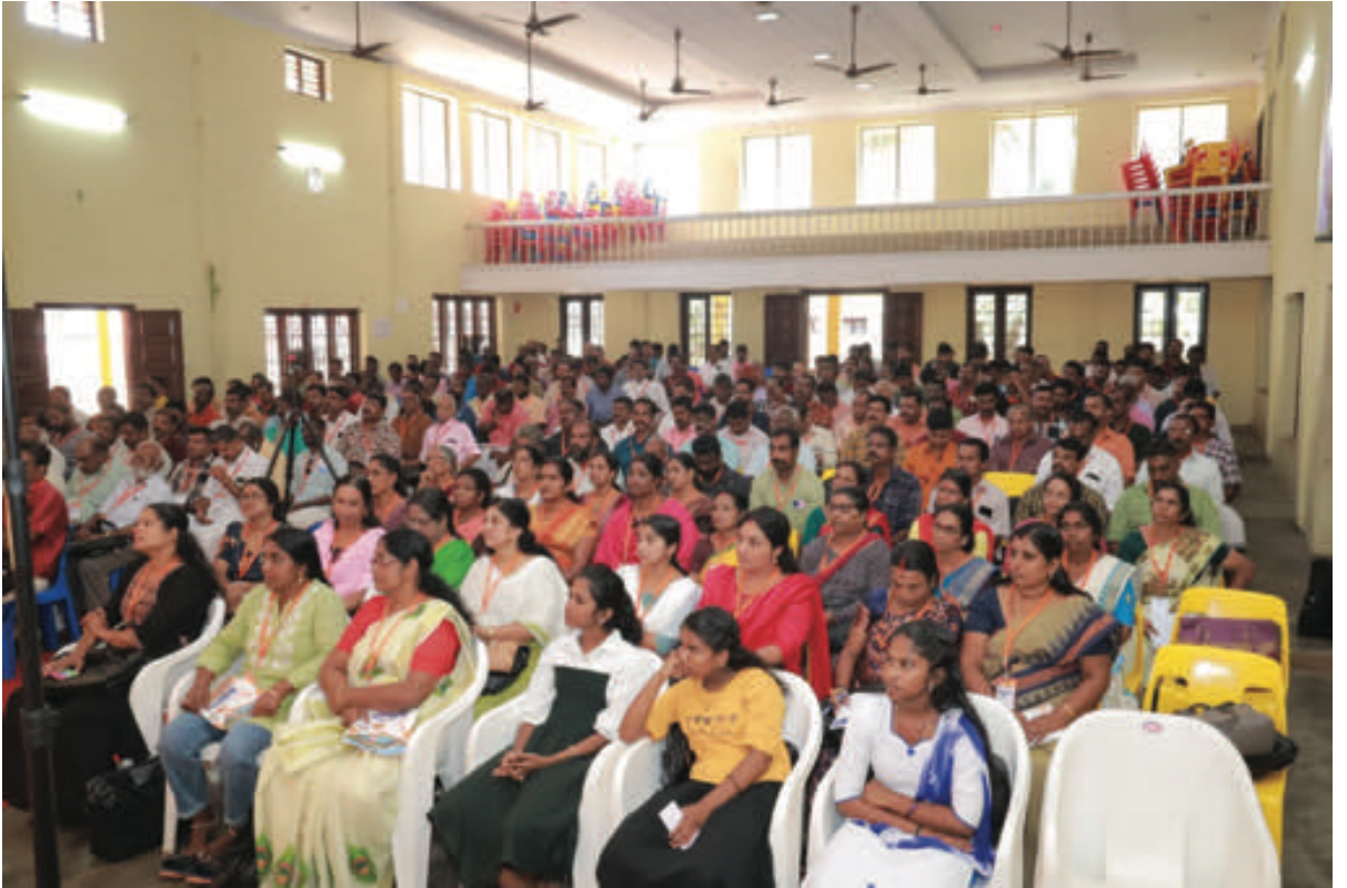
ആലപ്പുഴ ജില്ലാ സമ്മേളനത്തിൽ പങ്കെടുത്ത പ്രതിനിധികൾ.