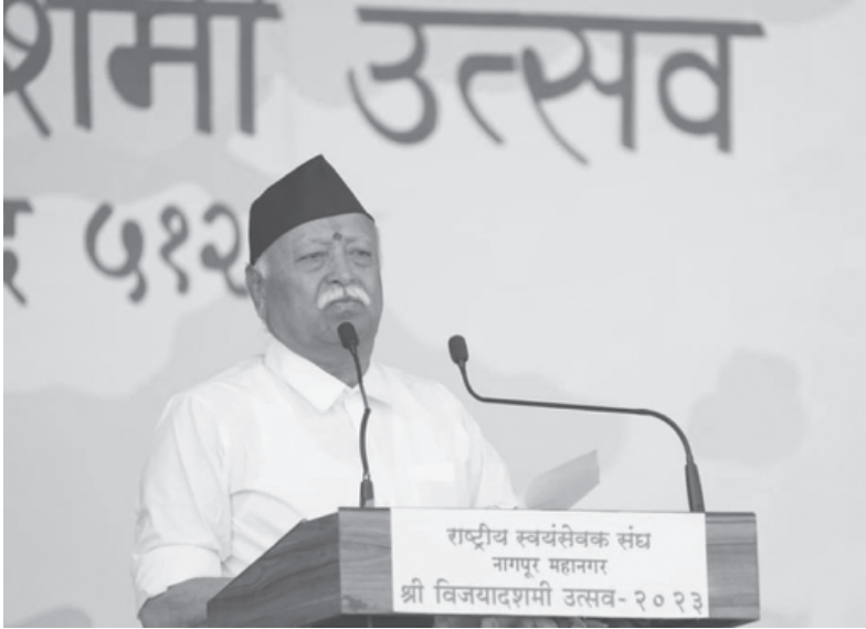
പുജനീയ സർസംഘചാലക് ഡോ. മോഹൻ ദാഗവത് വിജയദശമി ദിനത്തിൽ നാഗ്പൂരിൽ ചെയ്ത പ്രഭാഷണത്തിന്റെ