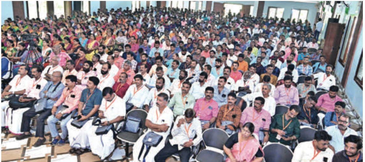
കാസർകോട് ജില്ലാ സമ്മേളനത്തിൽ പങ്കെടുത്ത പ്രതിനിധികൾ.

കാസർകോട് : ജില്ലയുടെ വികസന പിന്നാക്കാവസ്ഥ പരിഹരിക്കാൻ പ്രത്യേക പാക്കേജ് അനുവദിക്കണമെന്ന് ബി എം എസ് കാസർകോട് ജില്ലാ സമ്മേളനം ആവശ്യപ്പെട്ടു. ഇടതു വലത് മുണികൾ മാറി മാറി കേരളം ഭരിച്ചിട്ടും വികസനത്തിന്റെ രൂപി അറിയാത്തവരാണ് കാസർകോട് ജില്ലക്കാർ. കാർഷികം, വ്യവസായികം ആരോഗ്യം, വിദ്യാഭ്യാസം, തുടങ്ങി സമസ്ത മേഖലകളിലും ജില്ല ബഹുദൂരം പിന്നിലാണ്. നിത്യോപയോഗ സാധനങ്ങളുടെ വിലക്കയറ്റത്തിലും സർക്കാർ അടിക്കടി അടിച്ചേൽപ്പിക്കുന്ന നികുതി ഭാരത്താലും ജനം പൊറുതി മുട്ടുന്നു. സർക്കാർ ഉടമസ്ഥതയിൽ വ്യവയാധിക അടിസ്ഥാനത്തിലുള്ള ഒരു സ്ഥാപനം തുടങ്ങാൻ പോലും ജില്ലയിൽ ഇന്നേവരെ സാധിച്ചിട്ടില്ല. നിലവിലുള്ള ഒരു പൊതുമേഖലാ സ്ഥാപനം സർക്കാർ ഏറ്റെടുത്തെങ്കിലും