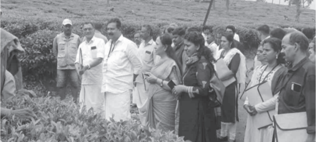
വയനാട് ചുണ്ടയിലെ തേയില എസ്റ്റേറ്റിൽ സന്ദർശനം നടത്തുന്നു

എറണാകുളം : ദക്ഷിണേഷ്യയിലെ പ്ലാനേഷൻ മേഖലയിലെ തൊഴിലാളികളുടെ ആരോഗ്യവും സുരക്ഷയും സംബന്ധിച്ച് അന്താരാഷ്ട്ര തൊഴിൽ സംഘടന ജപ്പാൻ ഗവണ്മെന്റിന്റെ സഹായത്തോടെ നടപ്പാക്കുന്ന പ്രോജക്ട്. കേരളത്തിൽ ബിഎംഎസുമായി ചേർന്നു നടത്തി. കേരളത്തിലെ ഇടുക്കി വയനാട് ജില്ലകളിലാണ് പരിപാടികൾ സംഘടിപ്പിച്ചത്. Occupational Safety and Health